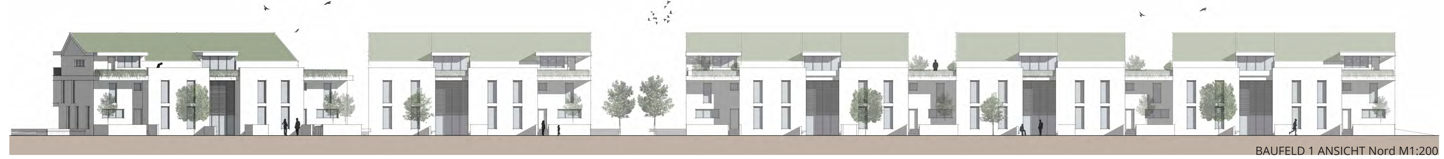
BAUFELD 1 ANSICHT Nord M1:200