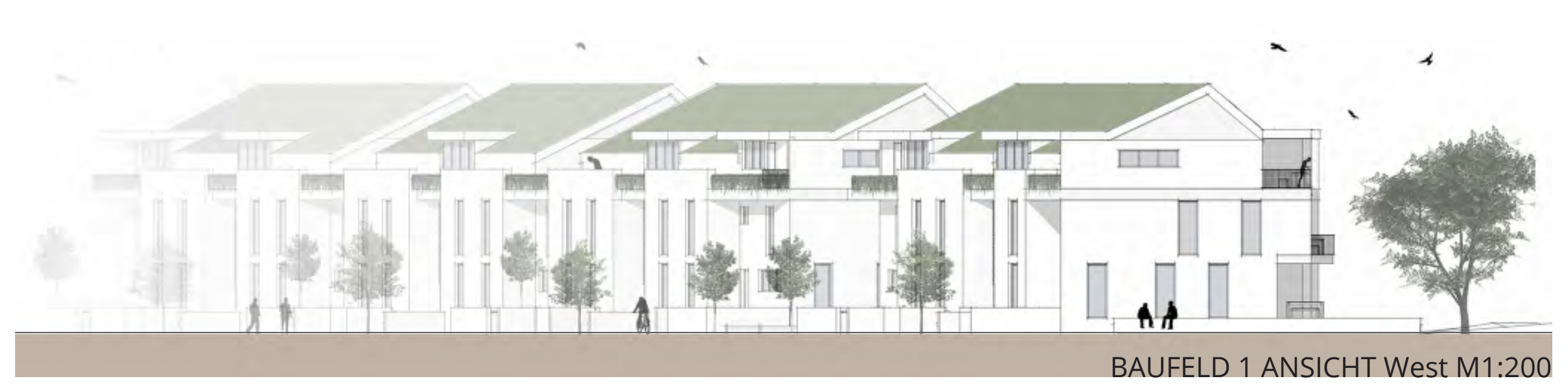
BAUFELD 1 ANSICHT West M1:200