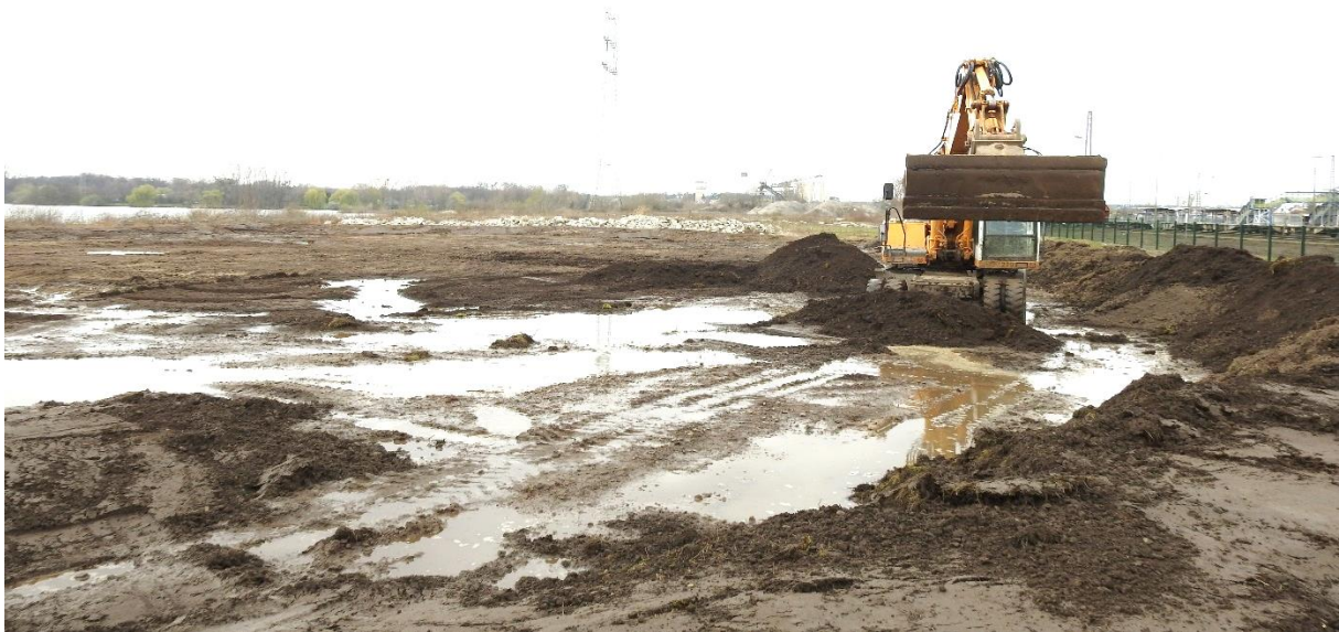
Herstellung flacher Geländemulden im Osten des Geländes, in denen sich anfallendes Regenwasser sammeln kann; Dies wurde als Ausweichhabitat für die Kreuzkröte hergestellt 17.03.2020