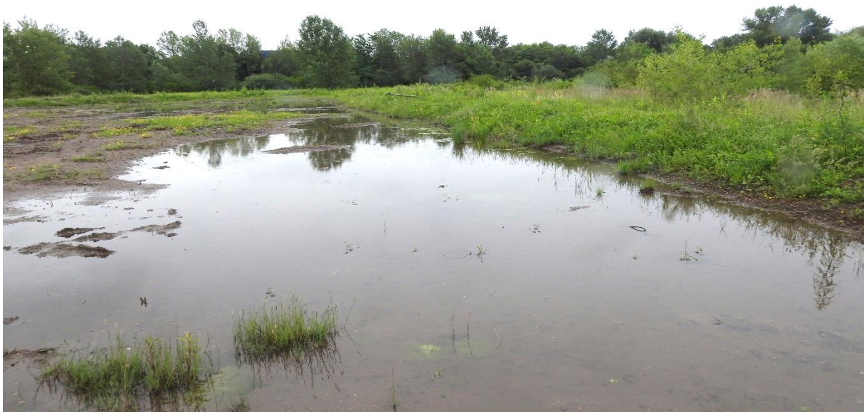
Im Frühjahr angelegte flache Geländemulden als Ausweichhabitat für die Kreuzkröte mit Blickrichtung Osten drei Monate nach Anlage dieser 16.06.2020