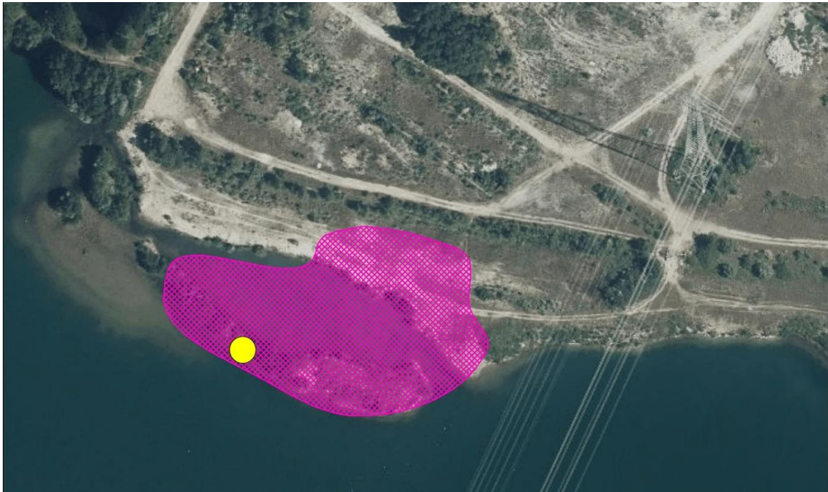
Abbildung 4 Abgrenzung des Reviers des Flussregenpfeifers mit Revierzentrum

Gleichzeitig konnte mit der Optimierung eines Ersatzhabitats durch Entfernen des übermäßigen Gehölzaufkommens am nördlichen Ufer sowie der dort vorgelagerten Kiesinsel im zentralen Teil des Schaufelegebietes eine erfolgreiche Besiedlung des Bereichs von Flussregenpfeifern auf der Kiesinsel dokumentiert werden.