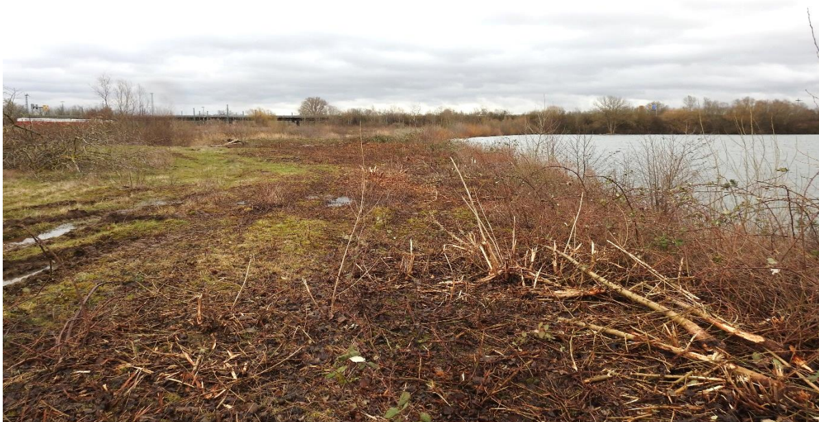
Gehölzrodungen am nördlichen Seeufer, um das Umfeld als Ersatzhabitat für den Flussregenpfeifer zu optimieren