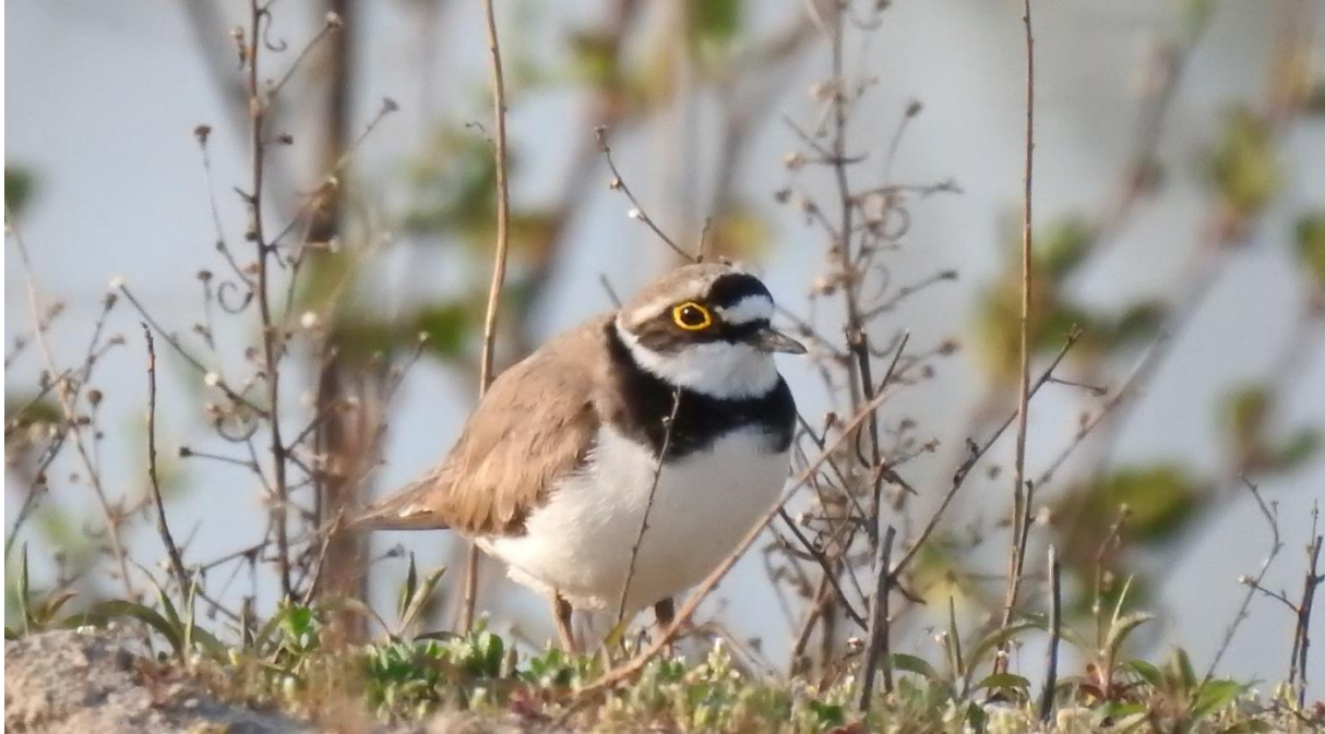
Flussregenpfeifer am Nordufer des Schauffelsee am 9. April 2020; Im weiteren Verlauf der Kartierung konnten weitere Sichtungen von Flussregenpfeifern im Umfeld der vorgelagerten Kiesinsel getätigt werden