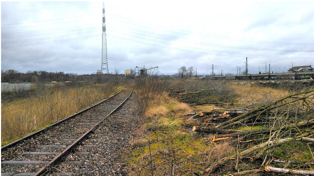
Gehölzentnahme entlang der alten Bahngleise im östlichen Teil des Geländes, um die Voraussetzungen als Habitat für Reptilien zu verbessern