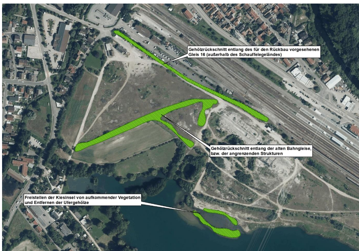
Abbildung 2 Gehölzrückschnitte im Spätjahr 2020