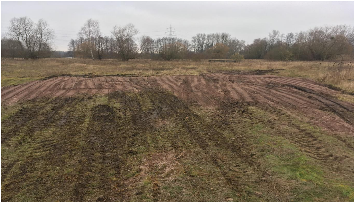
Vergrämungsmaßnahmen für die Kreuzkröte; Senken werden im westlichen Teil des Geländes mit Material verfüllt, um sich bildende Wasserlachen nach Regenereignissen zu verhindern