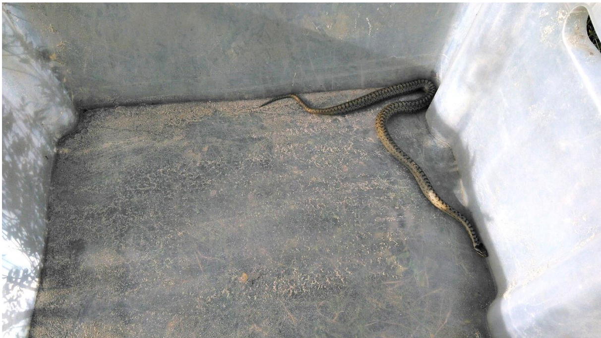
Aus dem Eingriffsbereich abgefangene Schlingnatter; Diese wurde wie alle anderen abgefangenen Reptilien in den östlichen Teil des Geländes an unterschiedliche Stellen verbracht