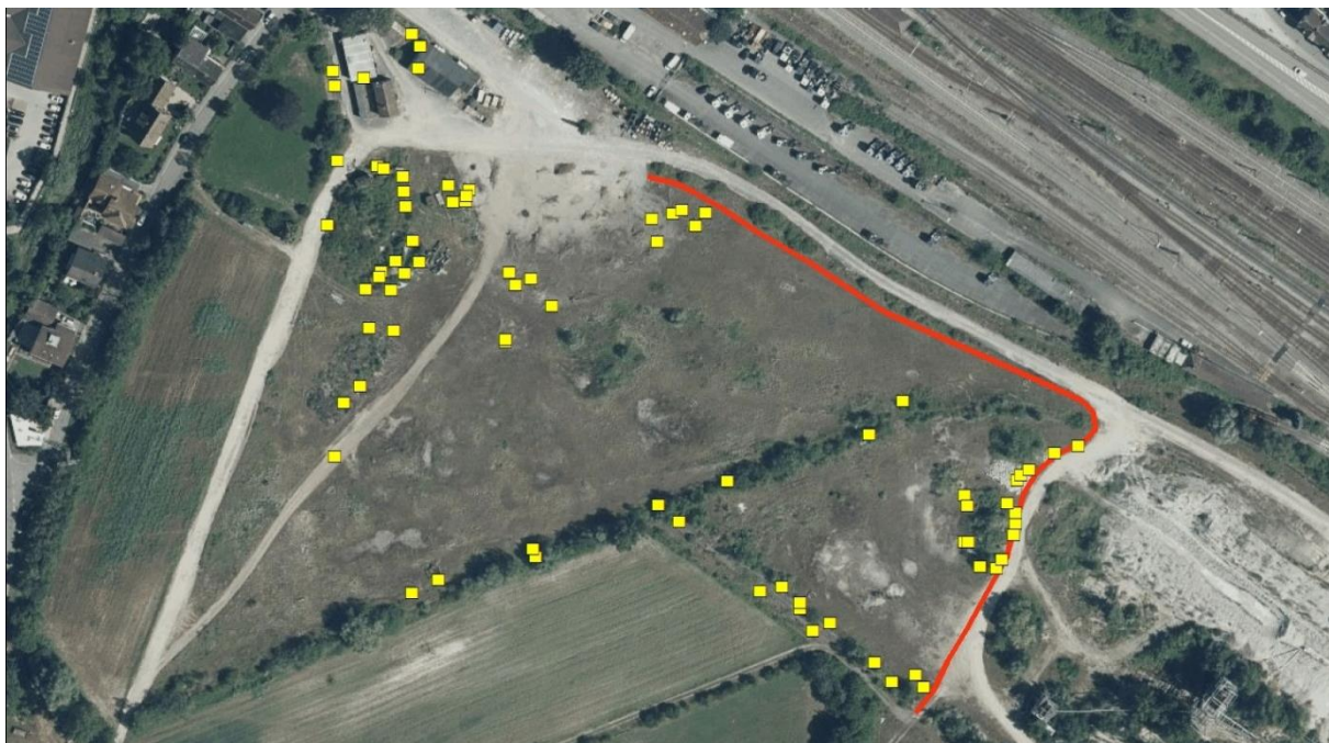
Abbildung 3 Lage des Reptilienschutzzaunes sowie der im Gelände ausgelegten künstlichen Verstecke

rote Linie Reptilienschutzzaun gelbe Quadrate ausgelegte künstliche Verstecke (kV)