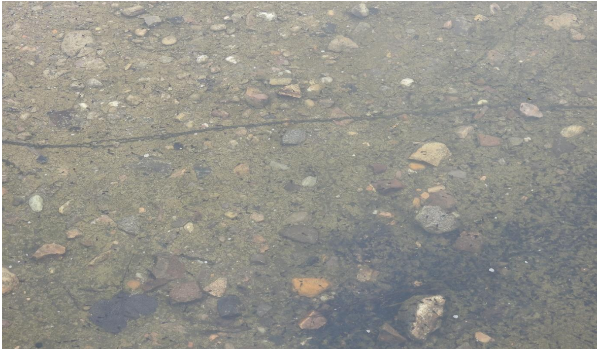
Erste Laichschnüre und bereits frisch geschlüpfte Kaulquappen konnten schließlich in diesen Wasserlachen vorgefunden werden