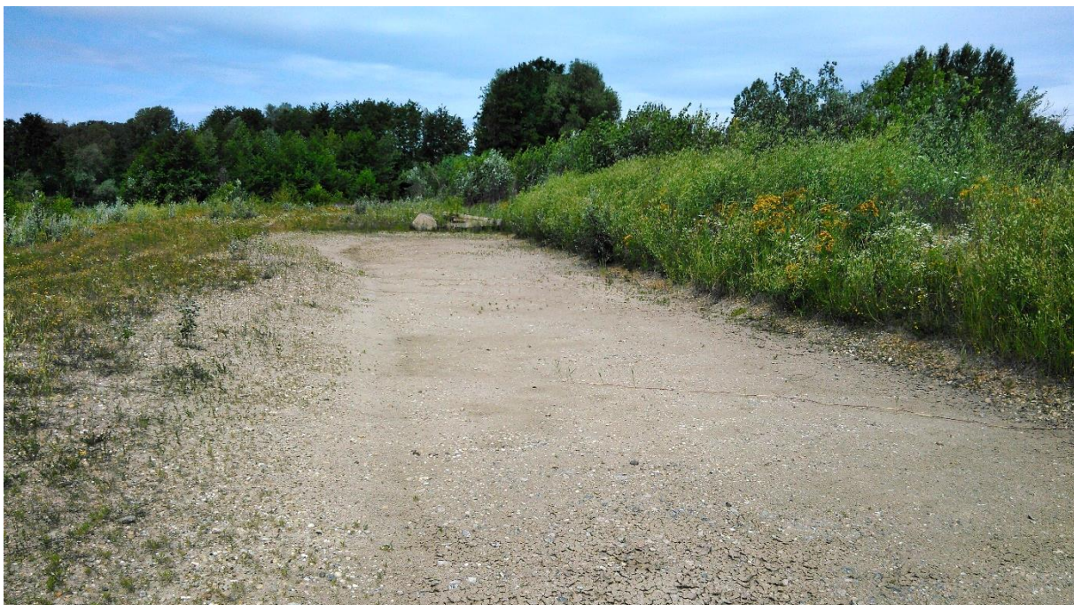
Ausgetrocknete Geländemulde nördlich des Schauffelsee; Hier konnten zu einem früheren Zeitpunkt noch Laichschnüre und geschlüpfte Quappen von Kreuzkröten vorgefunden werden, die es jedoch aufgrund des Austrocknens nicht geschafft haben, sich fertig zu entwickeln