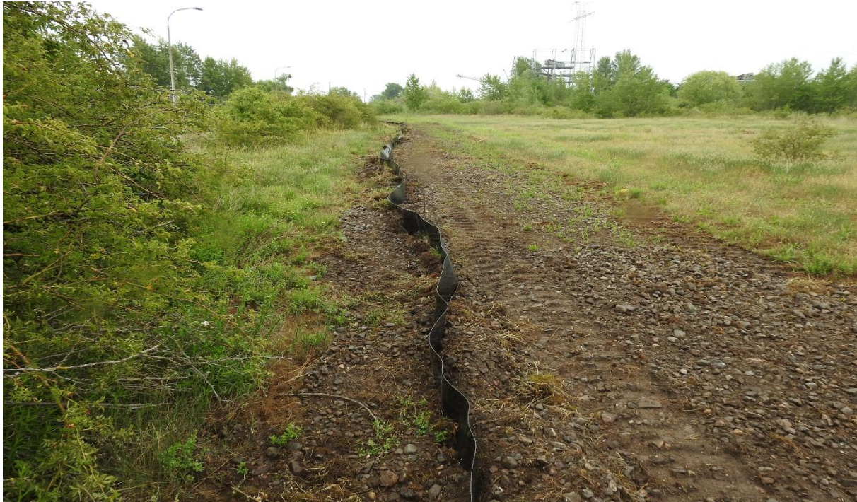
Aufgestellter Reptilienschutzzaun um den Eingriffsbereich herum