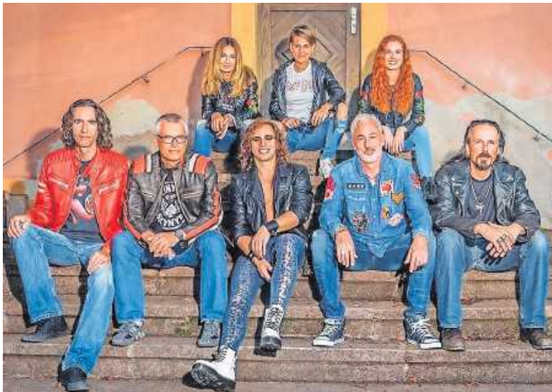
Dieses Jahr wieder dabei: Delta Rock

Vorverkauf startet am 21. Januar für Mitglieder des TV Wörth und am 3. Februar für alle