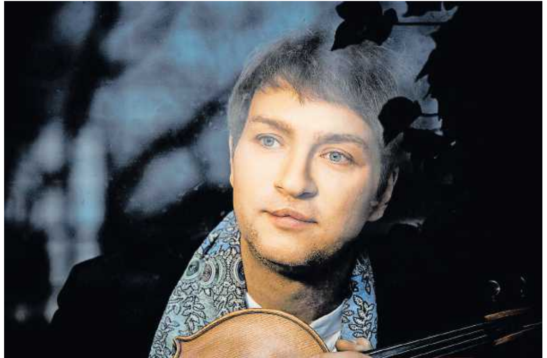
An der Viola Nils Mönkemeyer

Am Donnerstag, 28. September, 19.30 Uhr, eröffnet traditionell die Deutsche Staatsphilharmonie Rheinland-Pfalz den Kulturherbst 2023 der Stadt Würth am Rhein.