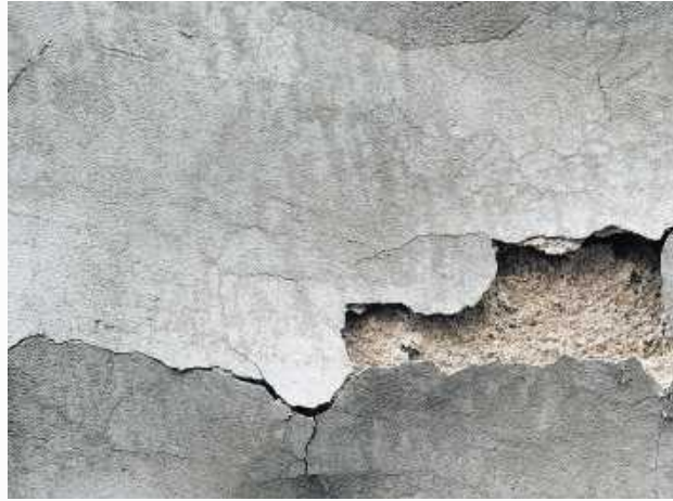
Es gibt viel tun an deutschen Gebäuden.

Viele Gebäudebesitzer wollen nicht sanieren, weil sie Angst vor zu hohen Kosten haben. Natürlich wird eine Sanierung teurer, je niedriger die Effizienzklasse, auf die man sein Gebäude saniert. Das liegt daran, dass der Arbeitsaufwand bei einer EH55-Sanierung deutlich höher ist. Hier muss eventuell nicht nur die Heizung getauscht, sondern auch gedämmt oder das Dach komplett erneuert werden. Ein Energieberater kann vor Beginn des Projekts eine realistische Einschätzung geben. Angst braucht man