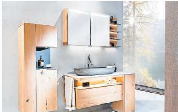
Der natürliche Möbelwerkstoff aus dem Wald kann durch hochwertige Fertigung gut mit Temperatur- und Feuchteschwankungen umgehen.

sche als auch Socken zu lagern. Dazu kommen leichtgängige Kleiderlifte oder Tablarauszüge mit Auflagefläche für Schmuck oder Armbanduhren. Ob mit Dreh-, falt- oder Schwebetür – für jeden Geschmack und jedes Schlaf- oder Ankleidezimmer gibt es eine passende Lösung, um die Kleidung vor Staub und dem Ausbleichen durch Sonnenlicht zu schützen. „Das flexibel gestaltbare Innenleben der robusten Massivholzschränke kann hervorragend an die Garderobe des Nutzers angepasst werden. Das sorgt für Übersichtlichkeit und spart an manchem Morgen wertvolle Zeit beim Ankleiden“, so Ruf. Nicht nur im Schlafzimmer sind diese praktischen Alltagshelfer von Vorteil: Am Beispiel der Küche lässt sich ihr großer Nutzen ebenso gut aufzeigen. Beim Kochen entsteht oft Wasserdampf