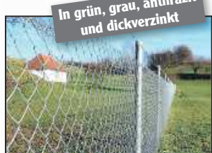
In grün, grau, anthrazit und dickverzinkt

Ein vollständiges Sortiment an Drahtwaren und Zubehör erhalten Sie bei HILA®, dem PROFI-Partner für Zäune und mehr in Landau.