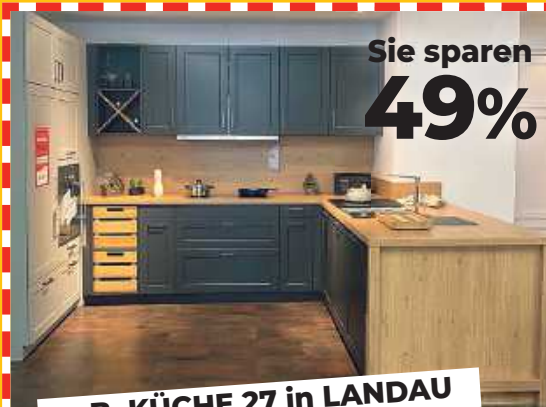
z.B. KÜCHE 27 in LANDAU