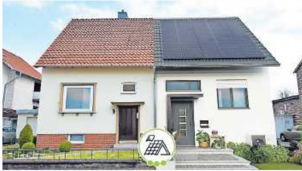
Wann ist der richtige Zeitpunkt für eine Dachsanierung ist?

Dach mit Ziegeln bis zu 80 Jahren und Schieferdächer bis zu einem Jahrhundert. Mit einer Dachinspektion oder Wartung können Sie in regelmäßigen Abständen den Zustand Ihres Daches von einem Dachdecker prüfen lassen. So fallen schneller Mängel auf, die Sie Instandsetzen können. Das garantiert Ihnen eine lange Lebensdauer. Wenn Sie sich für eine Photovoltaikanlage entscheiden, sollte eine Dachinspektion ein Muss sein. Prüfen Sie vorab, ob Reparaturen am Dach notwendig sind. Ist die PV-Anlage erst montiert, fallen nachträgliche Reparaturen teurer aus. Das Dach dämmen Bevor Sie mit der energetischen Sanierung beginnen, sollten Sie Ihr Haus auf Herz und Nieren prüfen. Der individuelle Sanierungsfahrplan (iSFP) gibt Ihnen Auskunft, wie Sie den Zustand Ihres Hauses