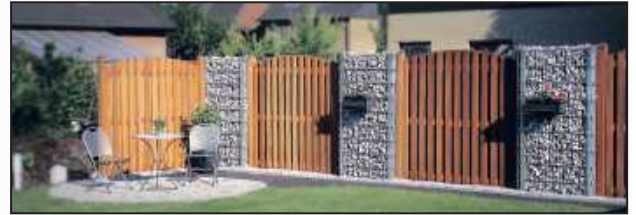
Die Gittersteinwand „Doppio“ für kreative Lösungen und lange Lebensdauer.

staltungselementen aus ALU, Edelstahl, Cortenstahl (Rostoptik), Glas oder hochwertigem Holz und WPC können hier besondere Akzente gesetzt werden. Inklusiv Sicherheit. Sichtschutzstreifen sind eine hervorragende Option, um Grundstücke gegen Blicke abzuschirmen.