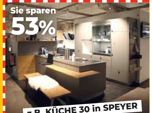
z.B. KÜCHE 30 in SPEYER