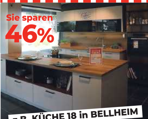
z.B. KÜCHE 18 in BELLHEIM