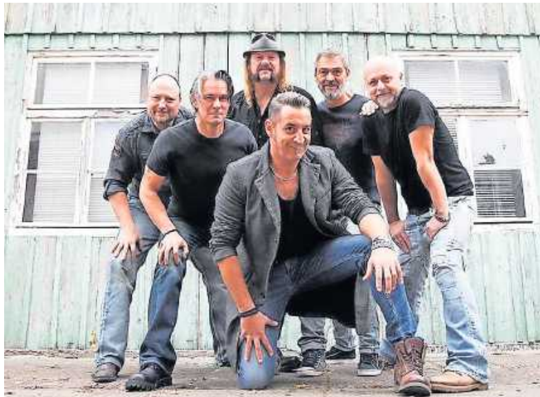
Spielt Songs der letzten 30 Jahre: Mad House

Die mittlerweile durch Rock am Altwasser und von der Oldie-Night her bekannte Band Mad House spielt Songs der letzten 30 Jahre. Komplettiert wird der Abend durch Delta Rock. Die Band steht für handgemachte Rockmusik aus dem Rhein-Neckar-Delta. Im Gepäck haben die acht Profimusiker Rockklassiker der 70er, 80er und 90er Jahre. Seit Februar 2021 ist Delta Rock offizielle Hausband von Radio Regenbogen.