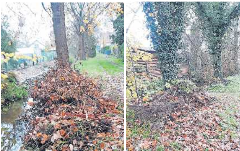
(Schaidt, An der Weth)

Aus gegebenem Anlass weist die Stadtverwaltung darauf hin, dass die Entsorgung jeglicher Abfälle auf öffentlichen Flächen verboten ist. Zuwiderhandlungen können mit einer Geldbuße geahndet werden. Dies gilt insbesondere für Grünabfälle.