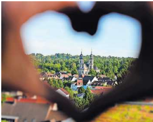
„I love Brusl“: Diese Aufnahme stammt von Wochenblatt-Reporter Alexander Riffel aus Bruchsal.

Das Besondere daran: Neben den Inhalten aus den Wochenblättern können alle Bürger der Region kostenlos Inhalte als Artikel oder Schnappschuss einstellen. Von Mai 2018 bis heute haben sich bereits über 10.000 Wochenblatt-Reporter angemeldet. Mit über 1,5 Millionen Seitenaufrufen und 730.000 Visits pro Monat (Stand 2020) und insgesamt über 100.000 Artikeln und Schnappschüssen ist wochenblatt-reporter.de schon jetzt das reichweitenstärkste Online-Portale für kostenlose