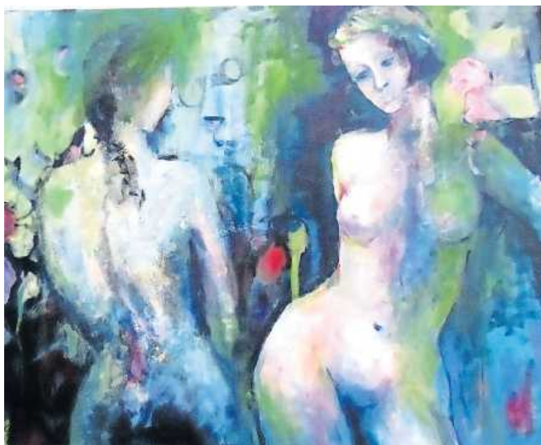
Werk von Christa Klöfer

20. März bis 3. April jeden Sonntag in der Tullahalle Maximiliansau