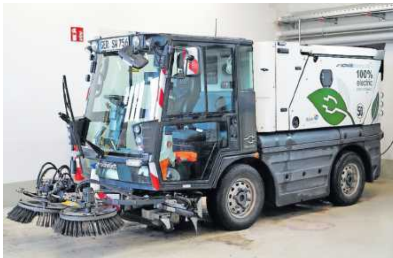
E-Kehrsmaschine aus dem Fuhrpark der Stadtverwaltung Wörth

Stadt Wörth am Rhein treibt nachhaltige Mobilität erfolgreich voran