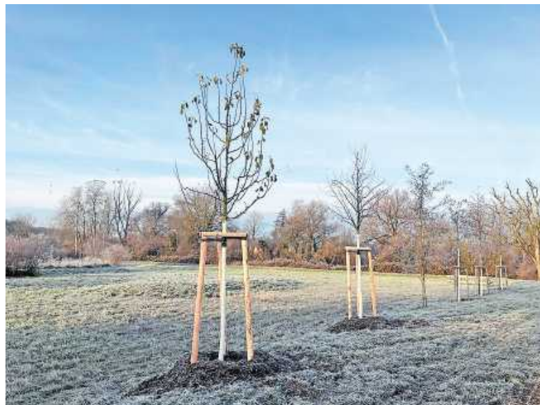
Unser Bild entstand im Abtswald Teil C

Jeder Baum zählt – und darum wird in Wörth am Rhein jetzt wieder fleißig gepflanzt. Es ist die beste Pflanzzeit für junge Bäume. Die sind wichtig, weil Bäume und Gehölze einen enormen Beitrag zur Verbesserung des Stadtklimas leisten. Doch auch ihnen macht die Hitze im Sommer immer mehr zu schaffen.