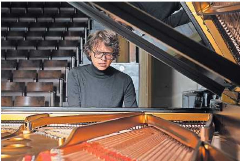
Solist des Abends: Lucas Debargue