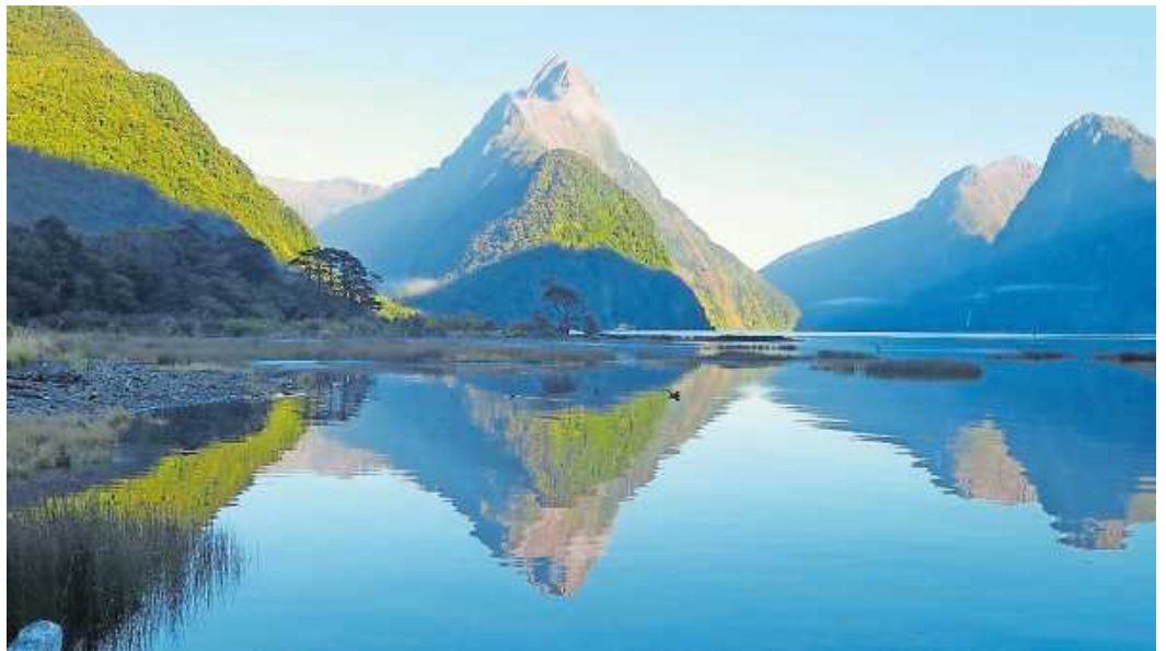
Mitre Peak im Fiordland-Nationalpark Neuseelands

Eine Reise ans andere Ende der Welt mit Günter Bernhart