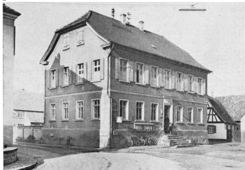
Rathaus und Schulhaus mit 3 Lehrsälen

Eine kleine Einweihungsfeier findet am Sonntag, 12. Februar, von 15 bis 18 Uhr am Fischbrunnen neben dem Bücherschrank statt. Interessierte sind herzlich eingeladen.