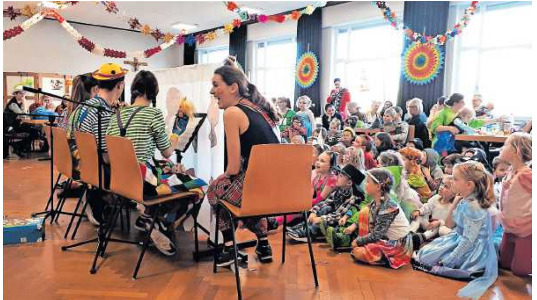
Kinderfasching im Pfarrsaal St. Theodard Würth

Nach langer Corona-Pause stehen sie wieder in den Startlöchern, die Fasenachter, Clowns und Tanzwilligen im Stadtgebiet Würth.