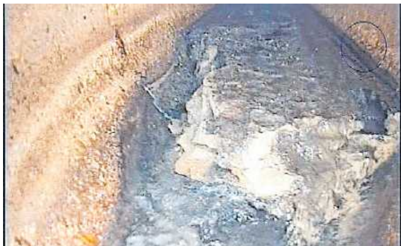
Vergrößerung des ersten Bilds