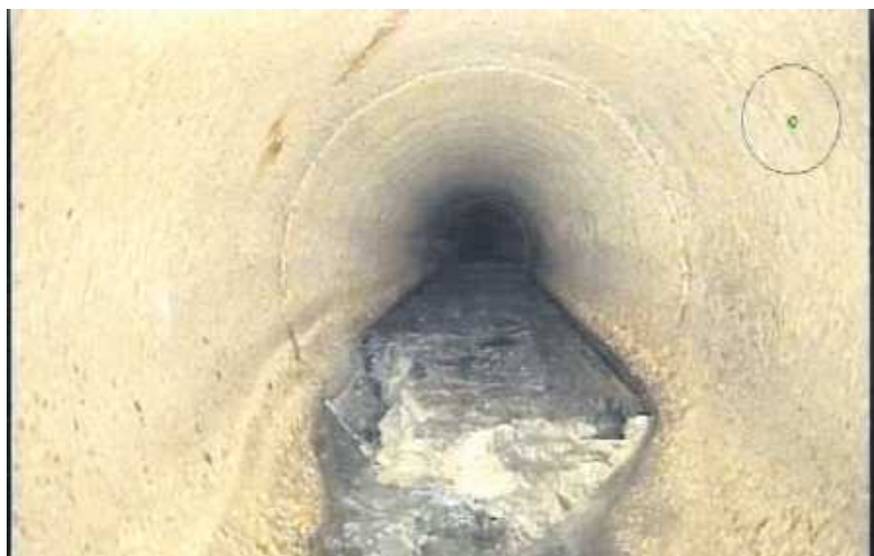
Ablagerungen durch Fehleinleitung

Die Gebäude- und Grundstücksentwässerung wird von der Stadt Wörth am Rhein über Grundstücksanschlüsse und Abwasserkanäle sichergestellt. Stoffe und Flüssigkeiten, welche nicht in das Kanalnetz eingeleitet werden dürfen, führen unter anderem zu Betriebsstörungen in den Abwasserkanälen und sind mit teils hohem Aufwand zu beheben.