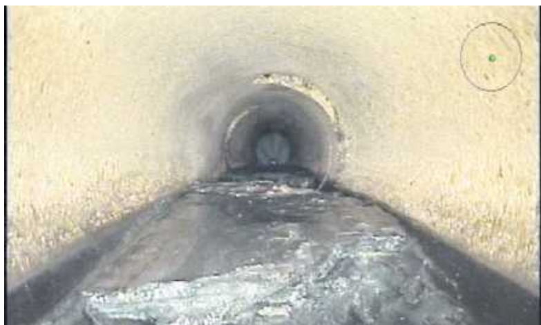
Ablagerungen durch Fehleinleitung

Insbesondere bei Einleitung von wasserbindenden mineralischen Baustoffen (z. B. zementgebundene Baustoffe und Gipse) lagern sich diese im Entwässerungssystem nach wenigen Metern im Kanal ab. Bei Einleitungen in größeren Mengen oder bei regelmäßig wiederkehrenden Fehleinleitungen sammeln sich die Fremdstoffe im Kanal an und können einen Großteil des zur Verfügung stehenden Rohrquerschnittes blockieren.