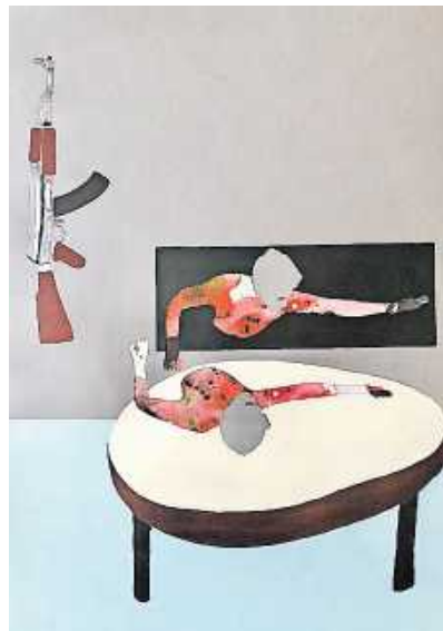
„Spiegelung“ von Stephan Pfeiffer

Der Kunstverein Wörth lädt ein zu seiner aktuellen Kunstaussstellung „Holz“ in die Städtische Galerie Altes Rathaus, Ludwigstraße 1 in Wörth. Die Ausstellung läuft bis 30. Juli. Wie bereits angekündigt, wird die Ausstellung am heutigen Freitag um 20 Uhr eröffnet.