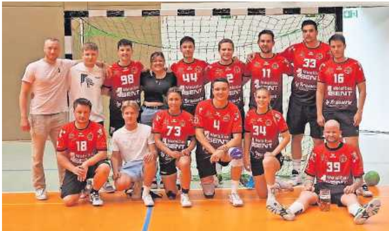
Sieger 2023: Team „76-er“

Wörth. Nach der langen Corona-Pause seit 2019 war es endlich soweit: Die Handball-Stadtmeisterschaften in Wörth fanden wieder statt – erstmals an drei Tagen. Zehn Mannschaften hatten gemeldet mit aktiven und nicht-aktiven Spielerinnen und Spielern. Der zuletzt zweimal in Folge erfolgreiche TVI („Immertoller Verein“) konnte seinen Titel nicht verteidigen. Sieger wurden in diesem Jahr die „76-er“.