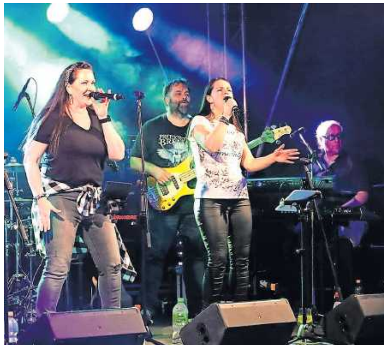
Ab 21 Uhr Live-Musik mit Jo's Mum