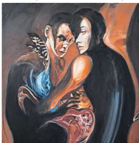
Frank Berendt: „Chimäre“ (2022, Öl auf Leinwand)

Ausstellung im Alten Rathaus – Finissage am 30. April