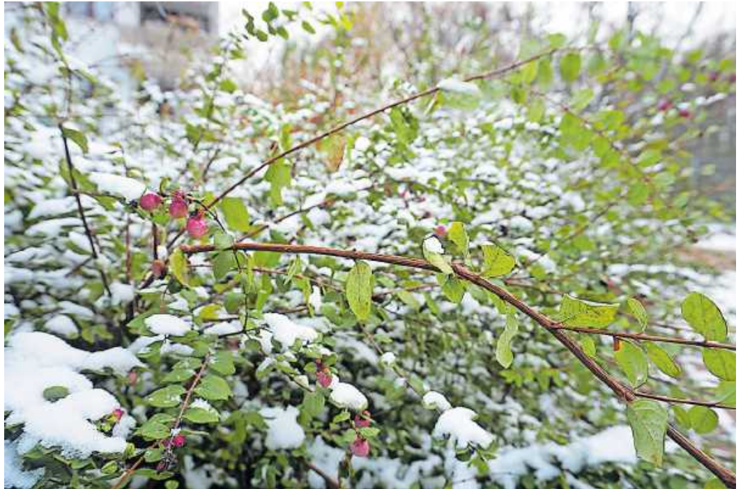
(Unsere Aufnahme entstand vor kurzem auf dem Rathausplatz)

Blutspendetermin, DRK-Ortsverein Schaidt, Kulturhalle Schaidt