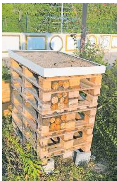
Insektenhotel auf dem Schulgelände

Schaidter Bürger dürfen sich gerne an Bestückung beteiligen