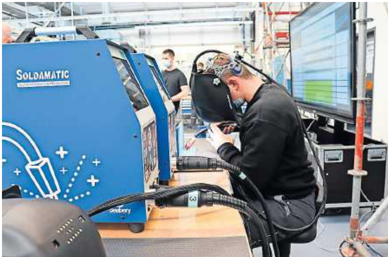
Auszubildende lernen im Mercedes-Benz Werk Würth in der digitalen Simulation das Schweißen

Das Werk Würth hält vielfältige Informationsangebote zur Berufsorientierung bereit. Beispielsweise findet jährlich die Berufsinformationsnacht, eine Art eigene Ausbildungsmesse für interessierte Schüler sowie Eltern, in der Ausbildungswerkstatt des Standorts statt. Auch Schülerpraktika im Werk und Veranstaltungen zur Berufsorientierung direkt an Schulen gehören dazu.