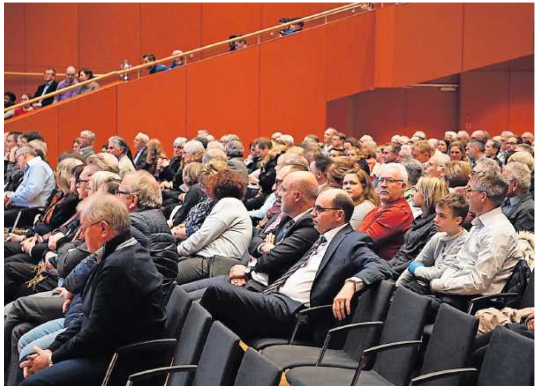
Viele Gäste konnten beim Neujahrsempfang 2019 in der Festhalle begrüßt werden

Zum 22. Neujahrsempfang der Stadt Wörth a. Rh. sind alle Einwohnerinnen und Einwohner der vier Ortsbezirke am kommenden Sonntag, 12. Januar, 18 Uhr, in der Festhalle Wörth, eingeladen. Der Neujahrsempfang gilt als Dank der Stadt an die kulturellen und Sport treibenden Vereine, Kirchen und Hilfsorganisationen sowie ihre Mitglieder für ihren Dienst an der Gemeinschaft.