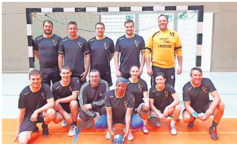
Sieger 2019: TVI

Wörth. Die Handballabteilung des TV 03 Wörth plant auch dieses Jahr eine Stadtmeisterschaft für alle Vereine und sonstige Gruppen – wenn das Coronavirus keinen Strich durch die Rechnung macht. Das Turnier findet am Freitag, 24. April, und am Samstag, 25. April, in der Bienwaldhalle statt. Für die ersten drei Plätze gibt es Geldpreise.