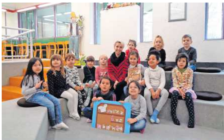
Zu Besuch: die Vorschulkinder der Kita Amadeus Wörth

In den vergangenen Wochen startete die Stadtbücherei Wörth wieder mit dem Vorleseprogramm für die Kitas. Gleich zu Jahresbeginn waren die Vorschulkinder der Kita Amadeus Wörth zum Thema Bauernhof eingeladen. Da war Sachwissen rund um den Bauernhof gefragt. Im Mittelpunkt stand die lustige Geschichte vom „Bauer Beck im Versteck“, die als Bilderbuchkino gezeigt wurde. Zum Abschluss gestalteten die Kinder gemeinsam einen Bauernhof, den sie in die Kita mitnehmen konnten.