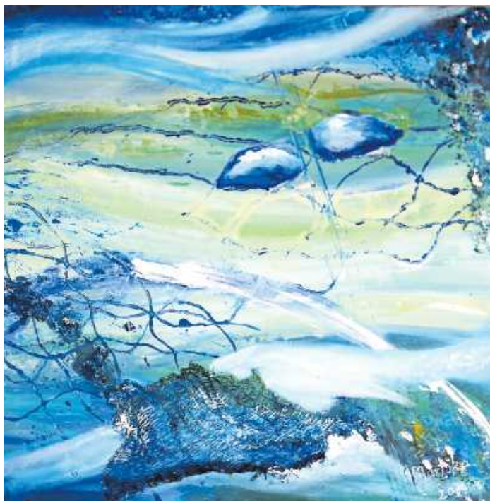
Werk von Martina Schneider

„Metropolen der Welt“ ist in diesem Jahr das Thema der Ausstellung des Malerrings Wörth-Maximiliansau vom 15. bis 29. März in der Tullahalle in Maximiliansau. Die Ausstellung bietet eine reiche Vielfalt an Themen, Techniken und Darstellungsformen. „Das Schöne unserer Malerei sind Ölfarbe und Terpentin. Eine innige und bleibende Liebe zur Kunst, Natur und Malerei wurde ausgelöst. Immer den Geruch davon in der Nase zu haben.“