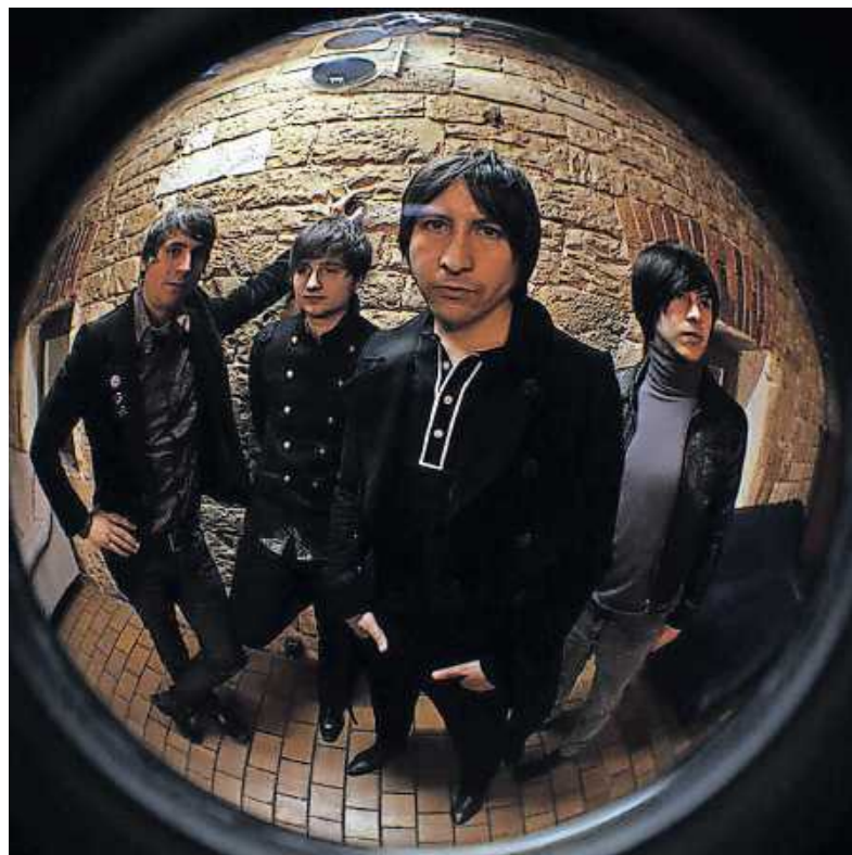
Die Blackbirds aus Stuttgart

Am Samstag, 21. März, startet um 20 Uhr in der Bienwaldhalle die weit über die Grenzen der Stadt hinaus bekannte Rock-Classic- und Oldienight der Handballabteilung.