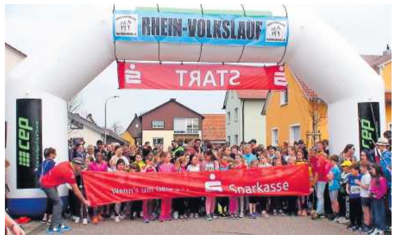
Start 2019 des 1000 m-Laufs der Schülerinnen

Die Ausschreibungsunterlagen für den 10. Sparkassen-Schul-Cup Wörth liegen ab 28. Februar in den Schulen aus und nach über 220 Zieleinläufern im Vorjahr peilt man eine neue Bestmarke für den Rahmenwettbewerb beim 43. Rhein-Volkslauf an. Nach den sehr guten Erfahrungen der Vorjahre setzt man auf klassenweise Voranmeldung; allerdings ist auch die Onlineanmeldung möglich. Die Startnummern sollen dann (klassenweise sortiert) in den Schulen abgegeben werden.