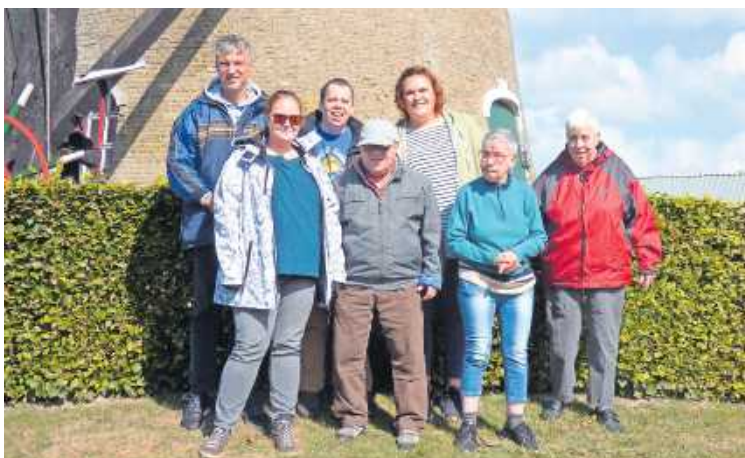
Unser Bild zeigt eine Gruppe bei ihrer Ferienfreizeit im September 2019 in Holland

Bitte mitbringen: bequeme Kleidung, Decke, warme Socken und ein festes Kissen. Die Kursgebühr beträgt 10 EUR (im Kurs bei Anne Sadowski zu entrichten). Info und Anmeldung bei der VHS Würth, Tel. 07271-131-225 oder vhs@woerth.de.